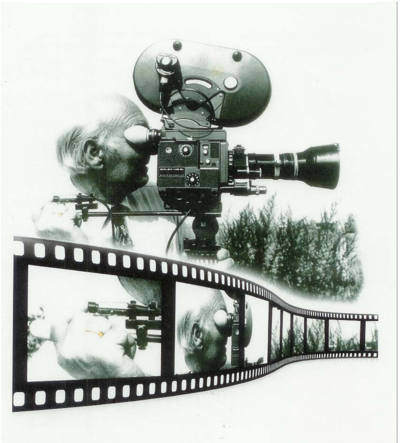
Barend de Vries achter zijn 16mm Bolex-Paillard camera